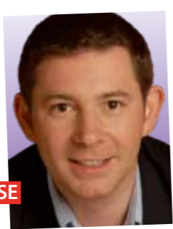
Dimitri LEGASSE Bourgmestre